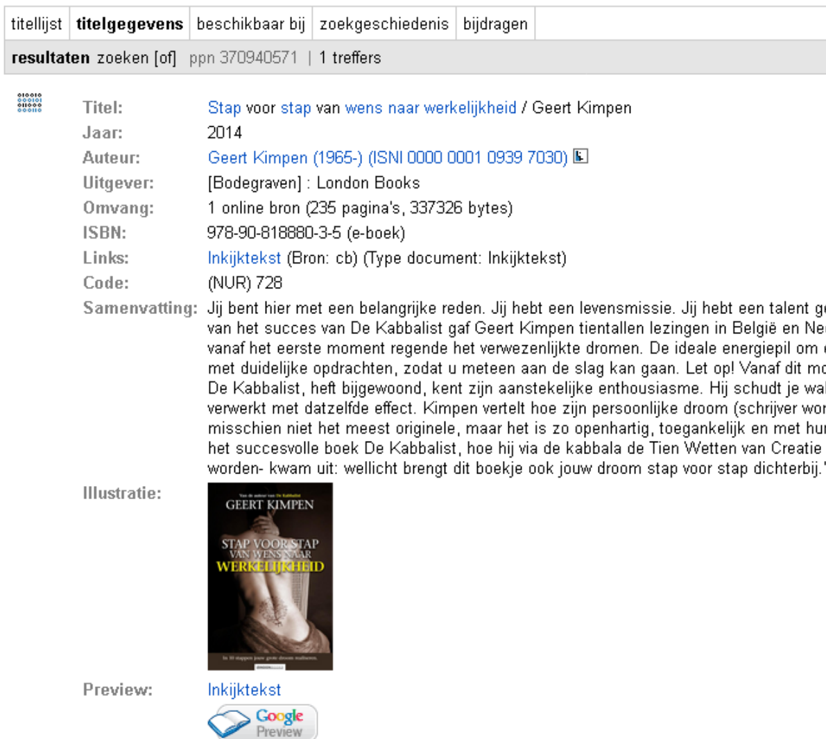
Figuur 1. De EPUB-link staat onder "Preview".

EPUB-links zijn vanaf versie 8.0 beschikbaar (Figuur 1). De meeste browsers bieden deze bestanden aan als downloadbaar bestand. U heeft lokaal geïnstalleerde software nodig om deze bestanden te kunnen bekijken (losgekoppeld van CBS-software). U kunt uw browsers zo configureren dat ze automatisch de juiste applicatie starten. Ook kunt u zelf een plug-in voor uw browser zoeken en installeren om EPUB-bestanden te tonen in een apart tabblad of scherm.